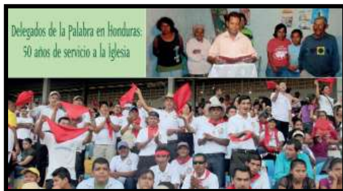
Celebrando los 50 años de los CPDH (2016)