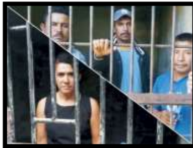
Delegados encarcelados en Honduras por defender los recursos naturales (2019)