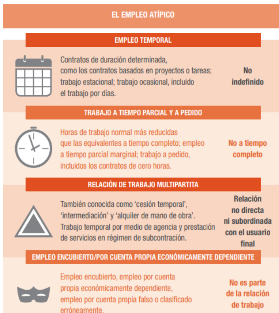
Tabla 4. Empleo Atípico