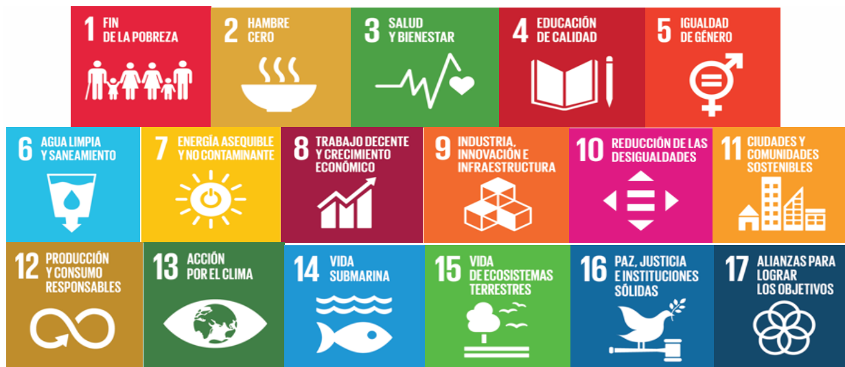
Tabla 3. Objetivos de Desarrollo Sostenible 2030.

Los Objetivos de Desarrollo Sostenible (ODS), también conocidos como Objetivos Mundiales, son un llamado universal a la adopción de medidas para poner fin a la pobreza, proteger el planeta y garantizar que todas las personas gocen de paz y prosperidad. El objetivo número ocho es precisamente el trabajo decente y crecimiento económico.